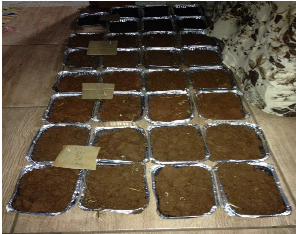
Figura 4 – Avaliação do banco de sementes em diferentes tipos de solo. Foto: GEWINSKI, F. G. Faculdades IDEAU, Getúlio Vargas, 2015.