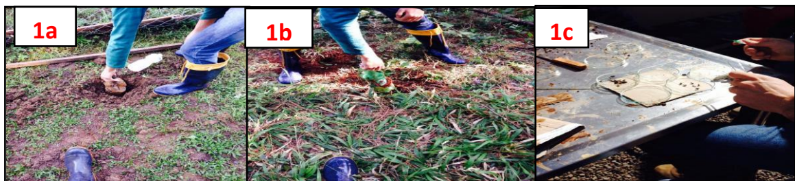
Figura 1 – 1a Armadilha Provid. 1b Coleta das armadilhas. 1c Contagem de microorganismos. Fotos: GEWINSKI, F. G. Faculdades IDEAU, Getúlio Vargas, 2015.

de sua base. Cada uma das armadilhas foram instaladas à campo, contendo em seu interior 200 ml de álcool 70% mais 3 a 5 gotas de formol a 2%, sendo acondicionadas no solo de modo que as bordas dos frascos ficassem ao nível da superfície do solo. Foram utilizados cavadeira e pá de corte para abrir as trincheiras, numa profundidade ideal para enterrar toda a garrafa pet de 2 litros ao solo. Após 4 dias do interrio, foram retiradas as armadilhas e levadas ao laboratório da Faculdade Ideau e procedeu-se a identificação e contagem dos organismos com auxílio de peneira para a separação dos resíduos e de lupa e microscópio para identificação da meso e macro fauna. Para auxílio na identificação foram utilizadas apositlas e livros.